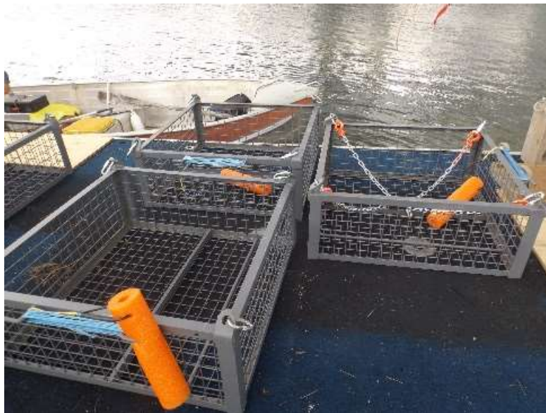
Figure 5 : Paniers métalliques fabriqués maison qui sont mis à l'eau et remontés par un treuil une fois remplis de sacs d'ancrage. Ils sont munis d'une bouée orange qui indique que le panier est plein et que la barge peut récupérer,