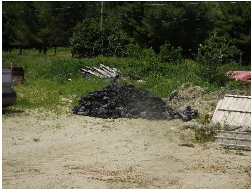
Figure 7 Site d'entreposage et d'élimination des sacs d'ancrage retirés.