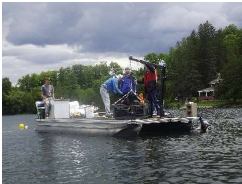
Figure 9 : Remontée d'un panier plein de sacs d'ancrage