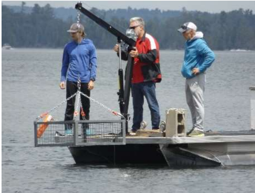
Figure 8 : Le treuil et le panier prêt à être déposé au fond de l'eau