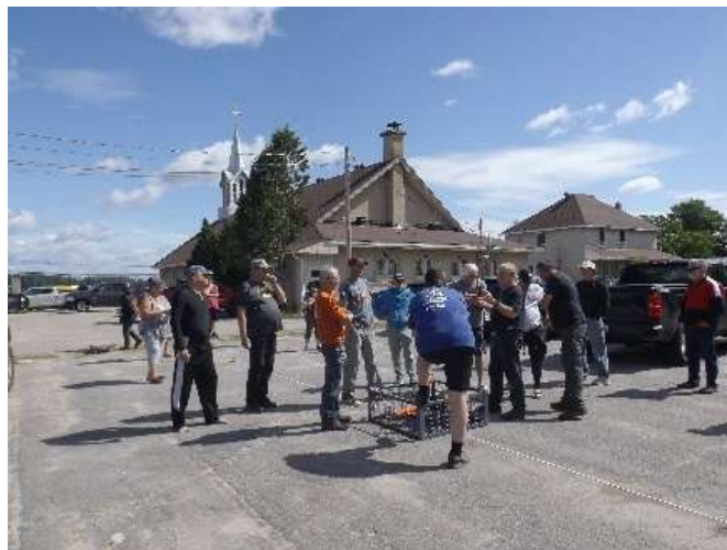
Figure 3 : Instructions pour la conformité environnementale, la méthodologie et la sécurité des opérations.