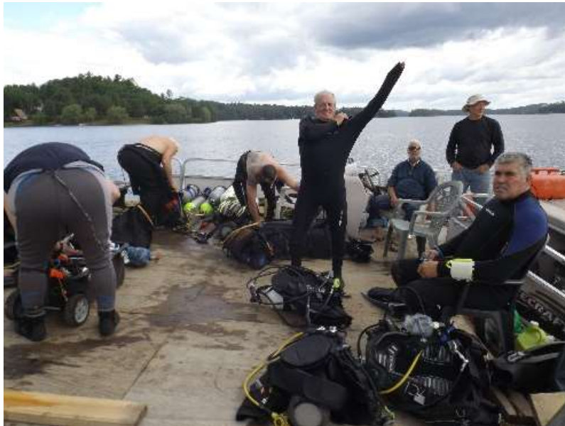
Figure 6 : Les plongeurs se préparent à récupérer les sacs